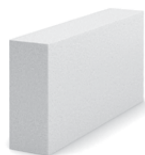
• 499 x 100 x 249