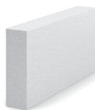
• 499 x 75 x 249