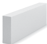
• 600 x 70 x 200